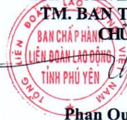
Phan Quốc Thắng