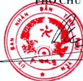
Phan Đình Phùng